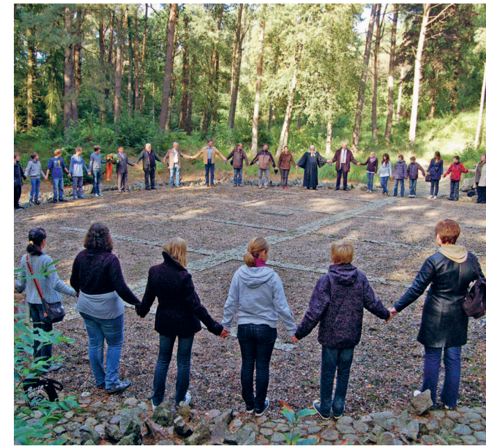
Foto: Besuch weißrussischer SchülerInnen in der Gedenkstätte Gudendorf, © Berndt Steincke